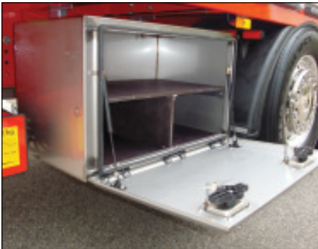
Werkzeugkiste aus Inox