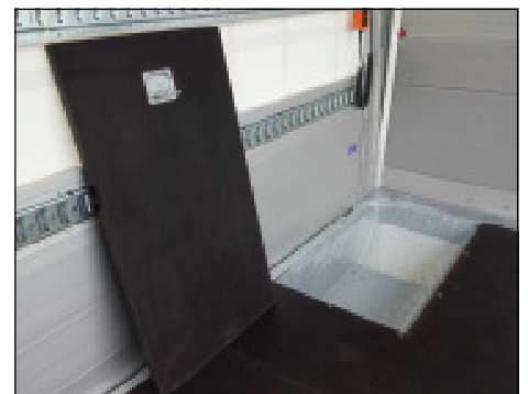
Bodenkiste mit Deckel