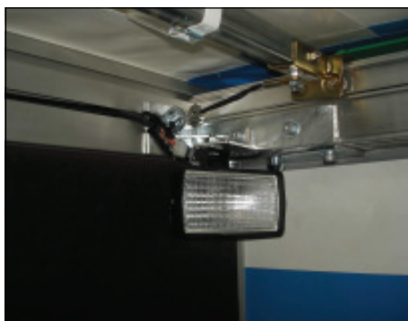
Arbeitsscheinwerfer auch in LED-Ausführung