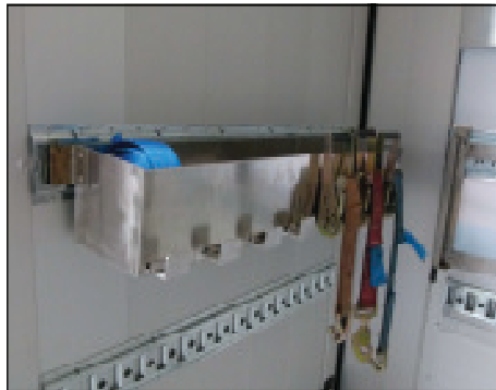
Spezialkiste für Zurrgurten