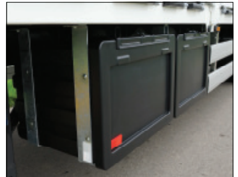
Werkzeugkiste aus Kunststoff