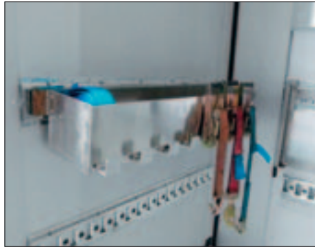
Spezialkiste für Zurrgurten