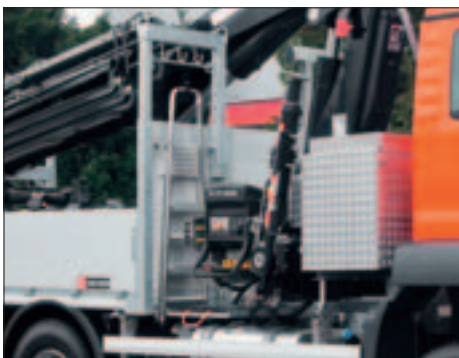
Stangenträger als Gurtenlager Alu-Leiter mit Halterung