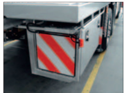
Überbreiten-Markierung ausziehbar, mit Positions-Leuchten