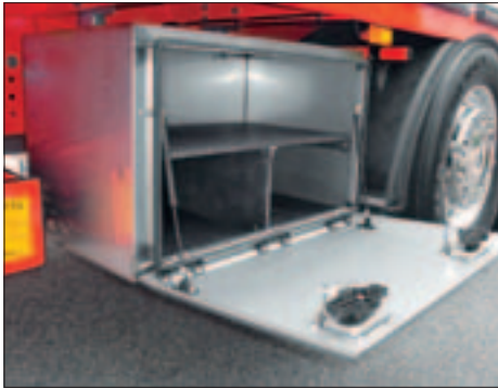
Werkzeugkiste aus Inox