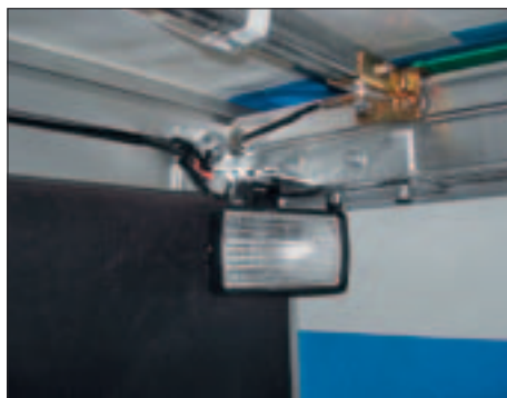
Arbeitscheinwerfer auch in LED-Ausführung