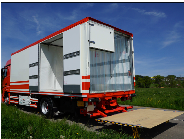
Seitentüren 180° umgelegt mit Doppelflügeltüren über Hebebühne