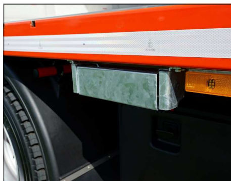
Aufstiegstreppe versenkt, eingefahren