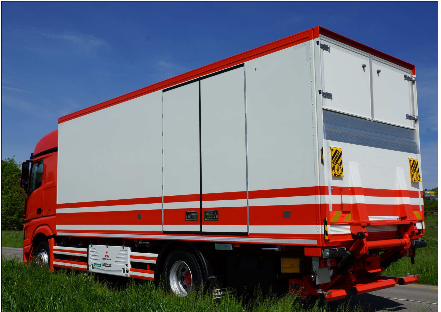
Lanz+Marti / Lamberet Kühlkoffer-Aufbau mit Seitentüren und Hebebühne