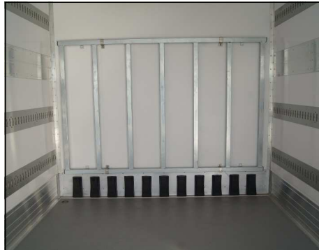
Stirnwandschutz mit Luftzirkulation