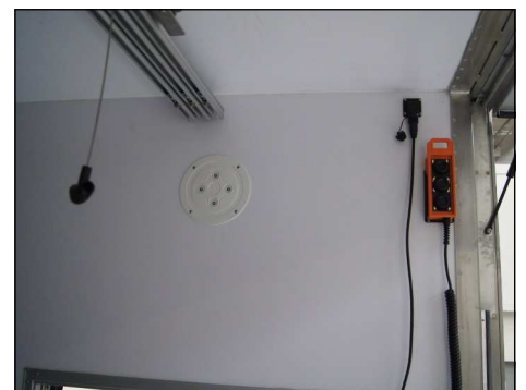
Seitliche, versenkte LED-Beleuchtung