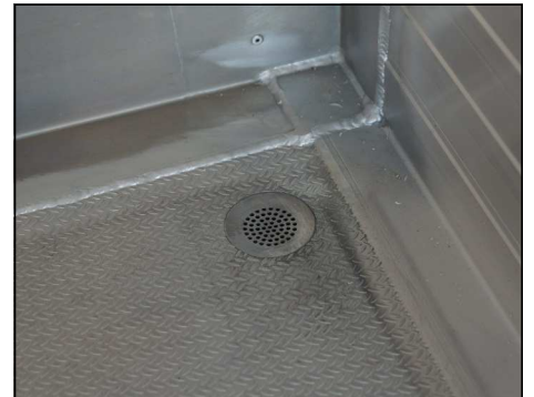
Boden mit Alu-Reiskornblech belegt