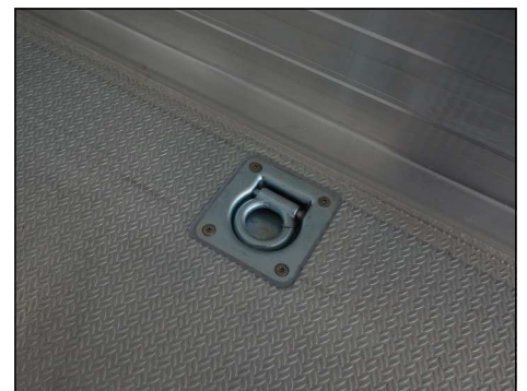
Ladungssicherung im Boden