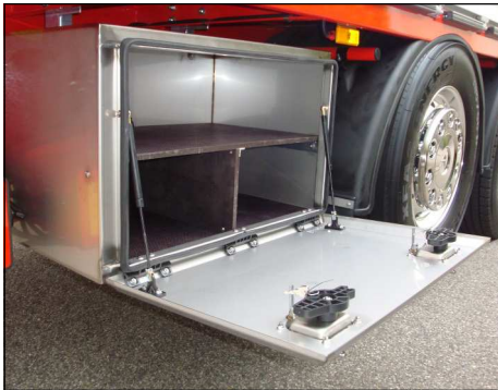
Werkzeugkiste aus Inox