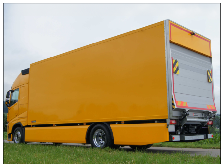
Kofferaufbau mit Unterfahrschutz komplett verschalt