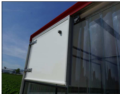
Doppelflügeltüre über Hebebühne